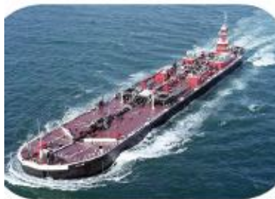
брод за превоз нафте (танкер)